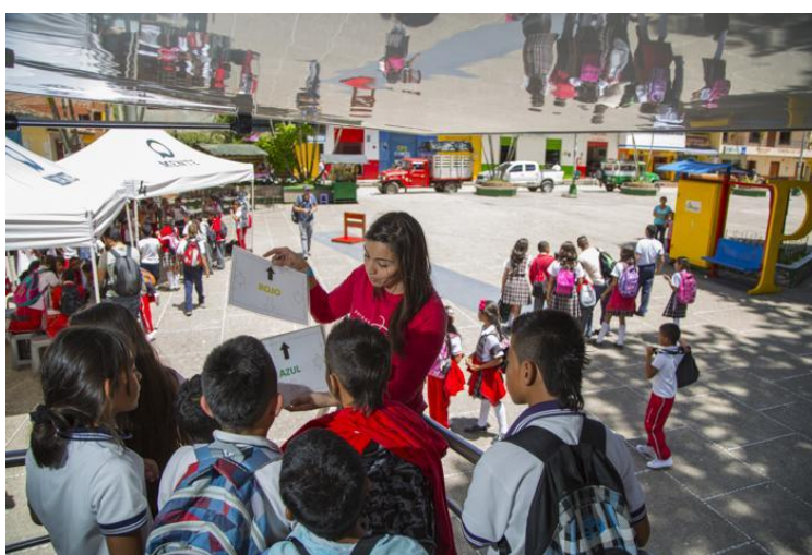
Figura 1. Exploramovil en uno de los municipios de Antioquia.

La estrategia de gestión social posibilitó, antes de la apertura de Explora, el relacionamiento de las comunidades con contenidos de ciencia y tecnología que promueven el desarrollo de competencias ciudadanas para la toma de decisiones informada y la búsqueda de soluciones a problemáticas locales. Uno de los formatos de esta estrategia, y que aún sigue vigente, es el Exploramóvil, un camión vestido con la imagen de Explora que visita las comunidades para desplegar experiencias interactivas y desarrollar actividades con las personas.