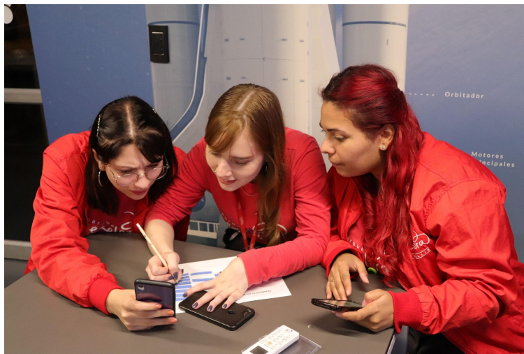
Figura 4. Actividad en formación continua.

La formación continua es el espacio ideal para reiterar el propósito de Parque Explora de promover la formación de ciudadanos críticos que toman decisiones informadas y aportar a la solución de problemáticas en los territorios. 10 Es una oportunidad para resignificar día a día la mediación como un ejercicio que tiene un sentido profundo hacia la transformación social y no simplemente como una transacción de venta. Metodológicamente, la formación continua promueve la participación a partir de ideas, visiones y reflexiones diversas. Es posible, y recomendable, que aparezcan tensiones constructivas y desacuerdos que posibilitan construir conocimiento colectivo.