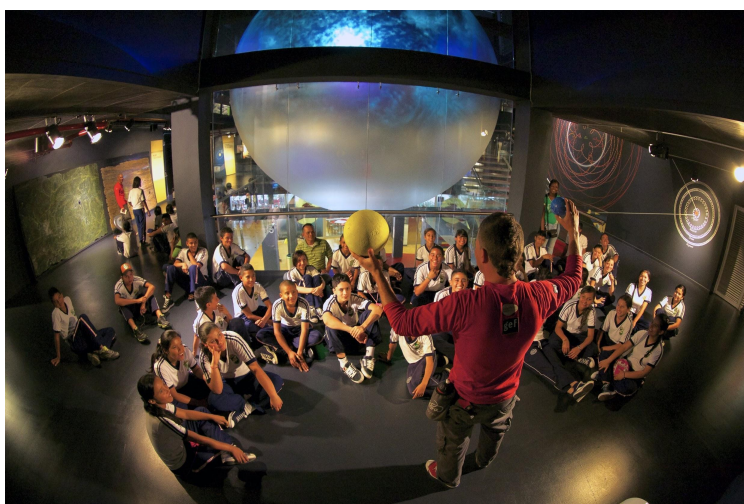
Figura 2. Mediador de Parque Explora con un grupo de estudiantes.

Estos tres elementos posibilitaron la creación de equipos de trabajo e instancias de articulación para la gestión de mediadores. El Área de Procesos de Parque Explora se encargó desde el principio de la planeación logística de la mediación. A su vez, el Área de Desarrollo Humano diseñó un programa de beneficios y acompañamiento para el crecimiento personal y laboral de los mediadores. Finalmente, el Área de Contenidos y Apropiación lideró la creación de la Escuela Explora que, con más de 10 años, se encarga del diseño e implementación de programas que posibilitan la formación permanente de los mediadores. Todos estos esfuerzos se articulan en el Comité de Gestión de Mediadores .